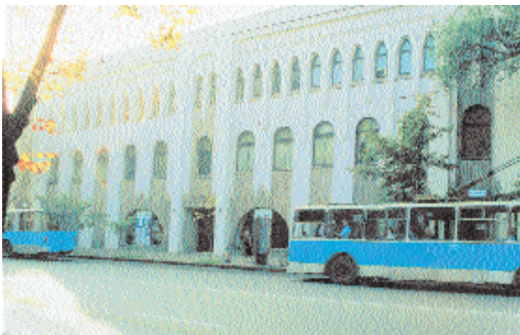
Здание филармонии, г. Ростов-на-Дону.

средоточена, а установленная мощность ТГС уменьшена, при этом циркуляции в системе ГВС нет. Вся система работает в ручном режиме (расчеты показали, что автоматика дороже всей системы), по согласованному графику концертов в течение недели, месяца и т.д. При этом экономия от эффективной работы ТГС и отдельных элементов системы составляет 35–39 %, от учета режима работы здания 55–62%.