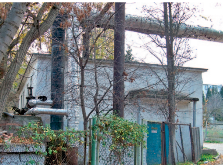
Рис. 5. Высвободившееся здание прежнего ЦТП

В результате могут быть высвобождены и предназначены для других нужд не только отдельные помещения (рис. 4), но и целые здания 1 (рис. 5). Именно это при правильном подходе к финансово-организационным вопросам позволяет получить дополнительный источник финансирования. Так, многие из высвободившихся помещений можно передать коммерческим структурам, которые создадут там согласованные с органами власти заведения досуга, бытового обслуживания населения и пр. Конечно, передача помещений должна осуществляться при условии обустройства объекта «планшетным» теплопунктом.