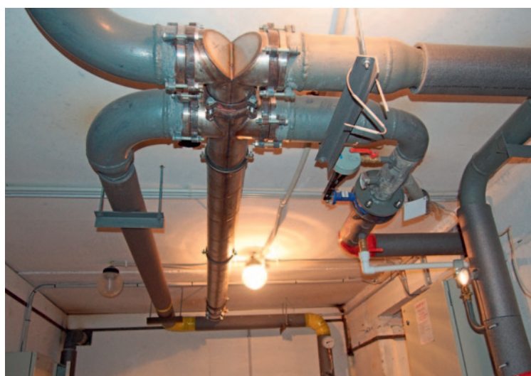
Рис. 3. Теплообменник ТТАИ под потолком подвала жилого здания