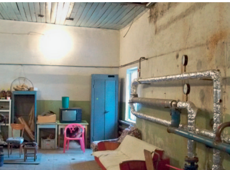
Рис. 4. Высвободившееся помещение прежнего теплопункта