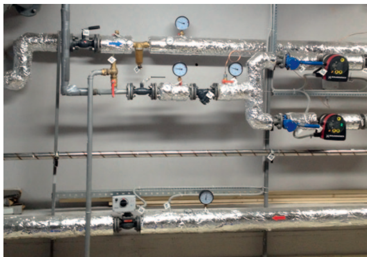
Рис. 2. Планшетный ИТП в подвале современного административного здания